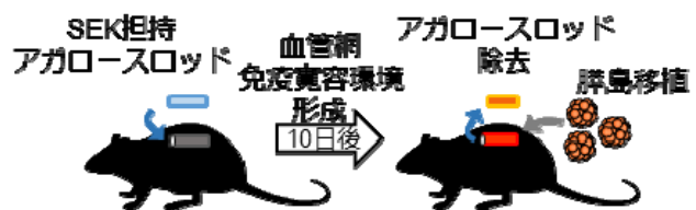
図1. 皮下への膵島移植の概略図

SEK100 µg を担持させたアガロースロッド（長さ25 mm，直径4 mm）を糖尿病ACIラットの背部皮下部位に埋入し10日後、多数の血管が形成された部位に浸潤した免疫細胞を解析した。SEK